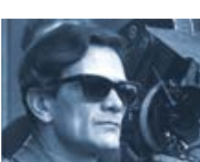
Pier Paolo Pasolini